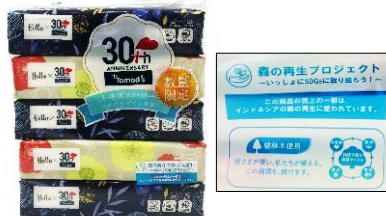
Tomod's様×ハロー 限定デザイン

どちらも「森P」ロゴが掲載されているので、店舗で見かけた際には、ぜひお手に取ってみてください。