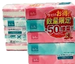
ドラッグモリ様×ハロー 限定デザイン