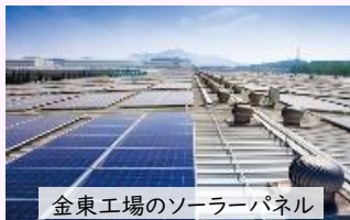
金東工場のソーラーパネル

既に導入済みの金東工場では、2013年からプロジェクトを開始し、2017年までに30MWのパネルを設置され、現在さらに増