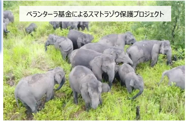
ベランターラ基金によるスマトラゾウ保護プロジェクト