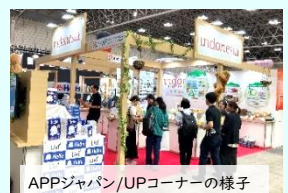
APPジャパン/UPコーナーの様子