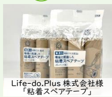
Life-do.Plus 株式会社様「粘着スペアテープ」