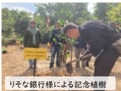
りそな銀行様による記念植樹