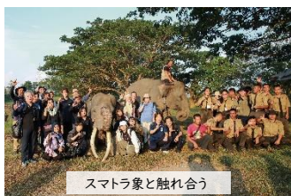
スマトラ象と触れ合う