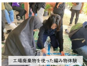
工場廃棄物を使った編み物体験

次の日は小雨が降る中、5年周期で収穫されるAPPの植林地を視察し、保護林区域を訪問した後、育苗研究所に移動して産業植林の苗をクローン生成する様子を見学しました。