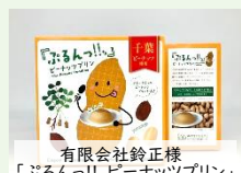
有限会社鈴正様「ぶいるんっ!! ビーナッツプリン」

エイピーピー・ジャパン株式会社(以下、APPジャパン)やユニバーサル・ペーパー株式会社(以下、UP)の紙製品を採用/使用いただくことで、どなたでも森Pに貢献できます。