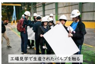
工場見学で生産されたパルプを触る

3日目は朝からインダキアット・ペラワン工場で原木から紙製品が出荷されるまでの一連のプロセスを見学し、午後は「森の再生プロジェクト～いっしょにSDGsに取り組もう!～」(以下、森P)の現場を訪れ、記念植樹を行った後に生徒の皆さんによる寄付金に対する感謝状の授与が行われました。最後に同一区画内で保護されているスマトラ象とも触れ合いました。