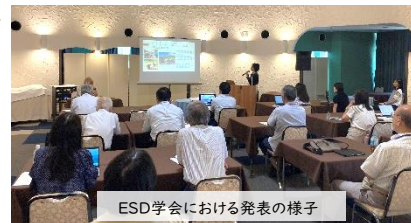
ESD学会における発表の様子