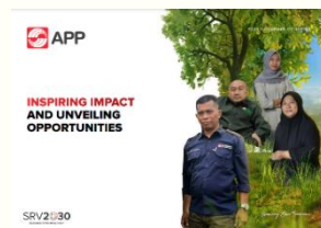
APPサステナビリティ報告書2023

7月25日、第13回APPステークホルダー・アドバイザリー・フォーラム(SAF)がオンラインとリアルで開催され、ジャカルタの会場には200名を超える参加者が集まりました。