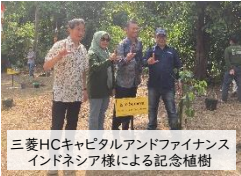
三菱HCキャピタルアンドファイナンス インドネシア様による記念植樹