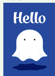
Hello ブランドアンバサダー「ハロたん」

2024年秋よりUPのHelloブランドがリニューアルされ、ティッシュ・キッチンタオル・トイレトロールなど全製品がブランドアンバサダー「ハロたん」のパッケージに順次切り替わります。もちろん、全製品が森P対象でロゴも表示されています。