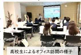
高校生によるオフィス訪問の様子

SDGsに貢献する活動などについて話をさせていただき、先生から「社会人の方々と交流できる貴重な機会でした。」とお言葉をいただきました。