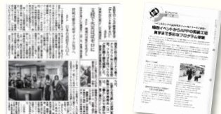
じゃかるた新聞記事 『Future』掲載レポート

紙パルプ業界誌『Future』では、9月9日号と9月23日号に詳細レポートが掲載されています。