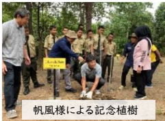
帆風様による記念植樹