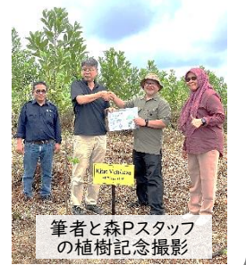
筆者と森Pスタッフの植樹記念撮影

お客様の「環境問題を自分事として捉え、次世代へ繋ぐ為に仕事と生活をする必要があると実感した」との声に、私も強く共感しました。