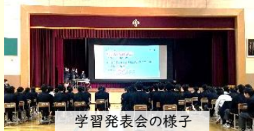
学習発表会の様子

3月上旬には、学習発表会が千寿桜堤中学校で開催され、APPジャパンの社員もご招待いただきました。当日は、保護者も見学されるなかで生徒の皆様による発表が行われ、完成度が高い発表資料を用意して皆様が自信を持って発表している姿が印象的でした。