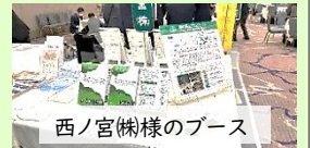
西ノ宮様様のブース

今年1月開催の「文具ユニオン展示会」にて、西ノ宮株式会社様の展示スペースをお借りして森P対象製品であるホワイトコピー用紙を紹介しました。