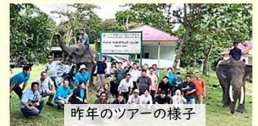
昨年のツアーの様子