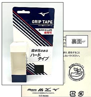
ミズノ株式会社様 「野球用グリップテープ」